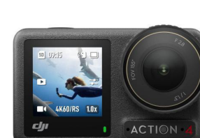
3º Lugar DJI Osmo Action 4 Standard Combo