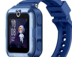
3º Lugar Huawei Smartwatch Watch Kids 4 Pro