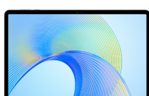
2º Lugar Honor Pad X9