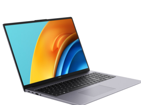
1º Lugar Huawei MateBook D16