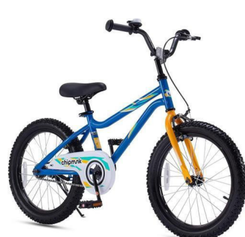
1º Lugar Royalbaby MK