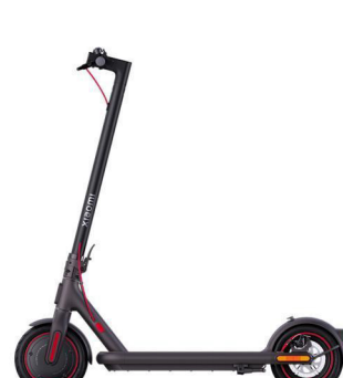
2º Lugar Patín Eléctrico Xiaomi Electric Scooter 4Pro